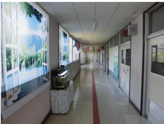
図書室前の廊下です。図書室は3つあります。