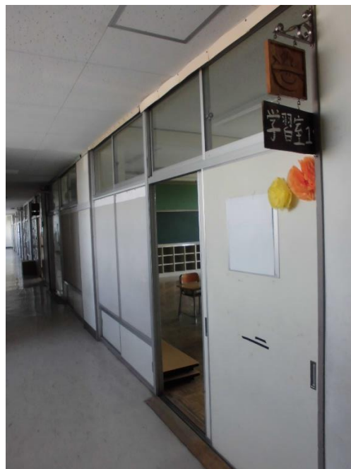
各学年に学習室があり、少人数指導や 面談などで使います。