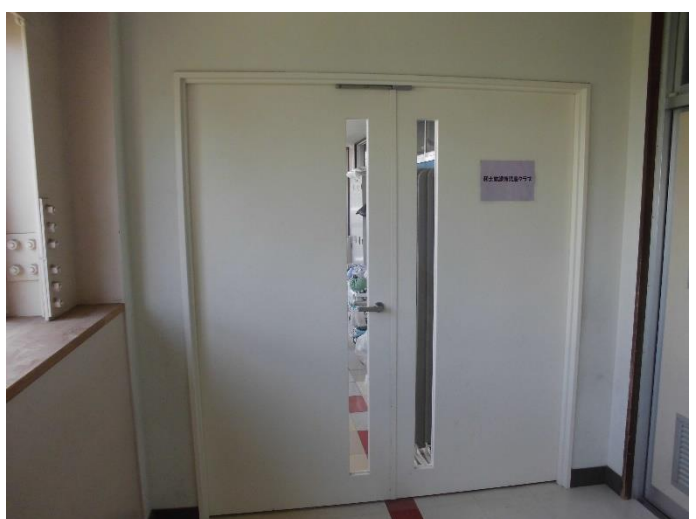
学校の中に学童があるので、移動が安心です。