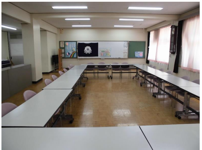
多目的室です。会議や集会で使います。