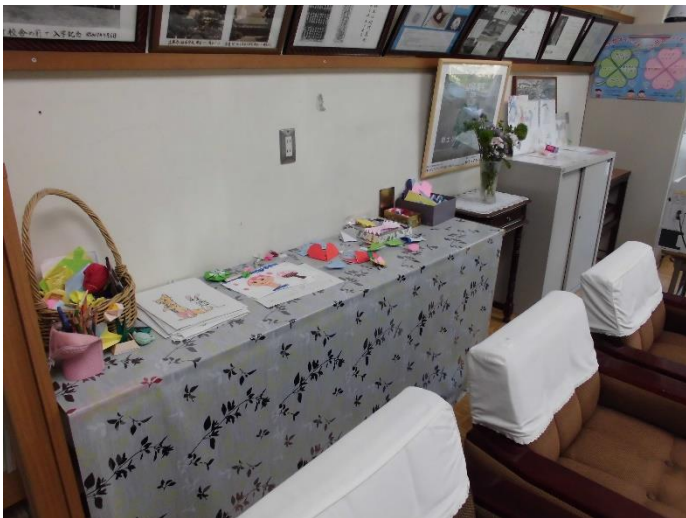
校長室には毎日遊びにくる子がいっぱいいます。