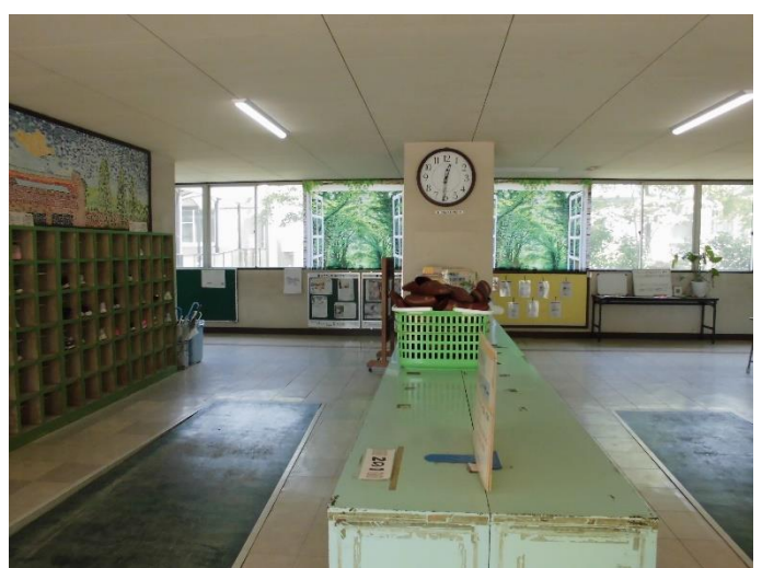
全員が使う昇降口です。光が差し込み明るいです。