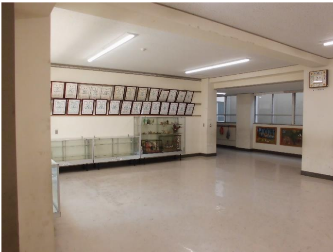
和土ギャラリーというスペースです。作品を飾ります。