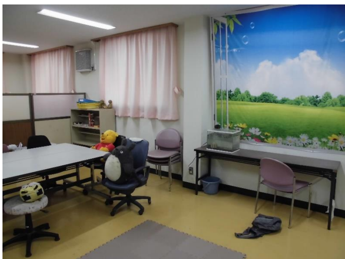
「Sola る一む」です。教室でなくても学習することができます。